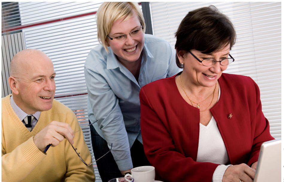
Neuvontapalvelumme kautta saa yhteyden alan asiantuntijoihin ja apua hankinnan suunnitteluun.