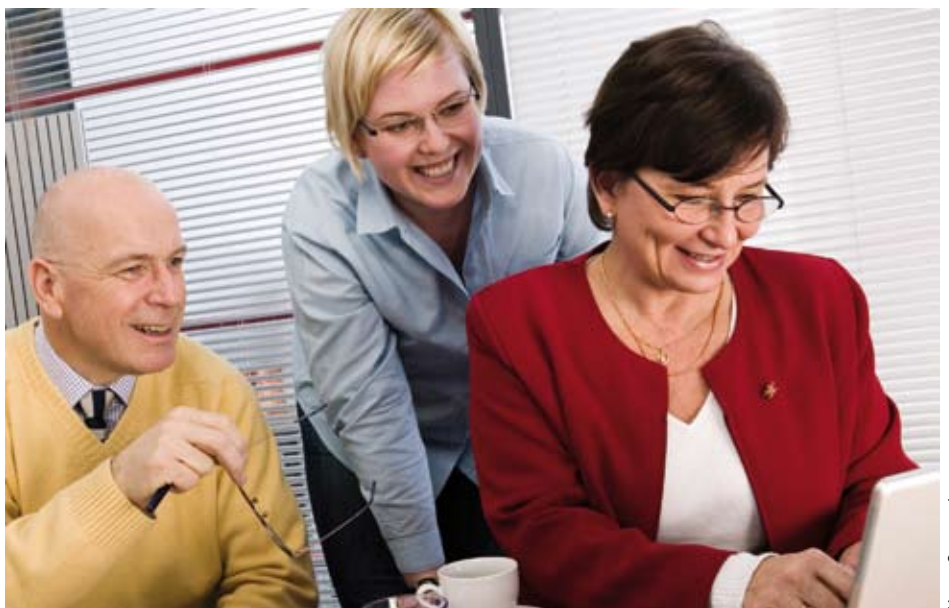
Neuvontapalvelumme kautta saa yhteyden alan asiantuntijoihin ja apua hankinnan suunnitteluun.