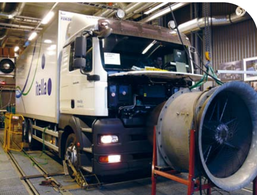
VTT:n kehittämä mittaamenetelmä paljasti eri automalleilla huomattavia eroja polttoaineen kulutuksessa ja päästöissä.

vat, ettei virhetilanteiden ja suoristettujen akselien välillä ollut havaittavissa eroa mittatarkkuuden rajoissa.