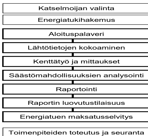
Kuva 2 Katselmushankkeen vaiheet ja tehtävät

Energiakatselmushankkeen eri vaiheet on esitetty kuvassa 2.