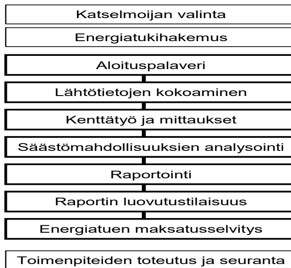
Kuva 2 Katselmushankkeen vaiheet ja tehtävät

Energiakatselmushankkeen eri vaiheet on esitetty kuvassa 2.