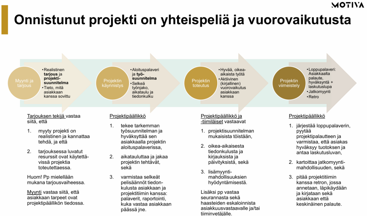
Kuva 2. Projekti